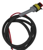
Przewód sterujący do przełącznika Cyrix-ct 12/24-230 Długość: 1 m