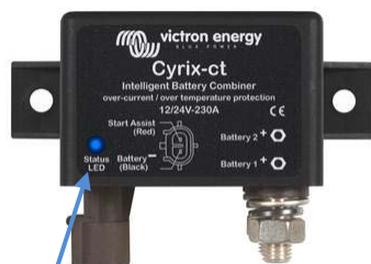
Wskaźnik LED stanu